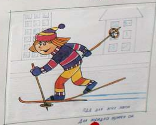
Для катания используйте специальные площадки