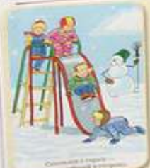
Спасите в случае чрезвычайной ситуации