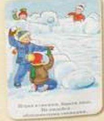
Игра в снежки, вышка снега. Не играйте на проезжей части