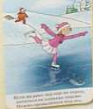
Если вы решили кататься на коньках, используйте специальные площадки