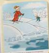
Скачочки и коньки в парках и на специальных площадках